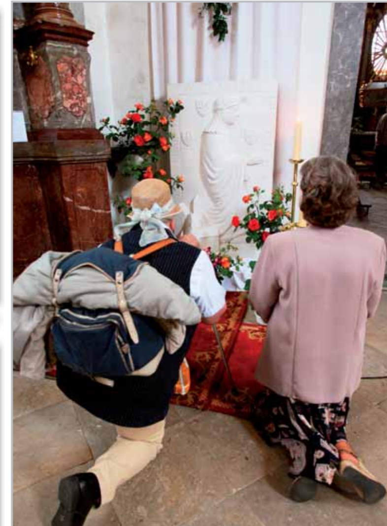
Prosbu před reliéfem sv. Anežky u klášterního kostela Narození Panny Marie o přímluvu u Boha.