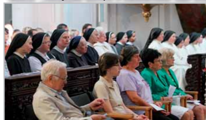
Při slavnostní bohoslužbě, která se konala o sobotu 11. června.