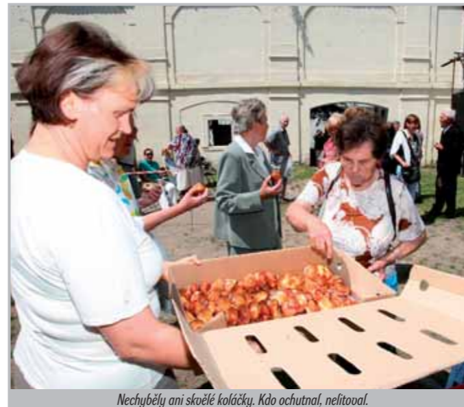
Nechyběly ani skvělé koláčky. Kdo ochutnal, nelitoval.

Fotogalerii naleznete na www.dltm.cz