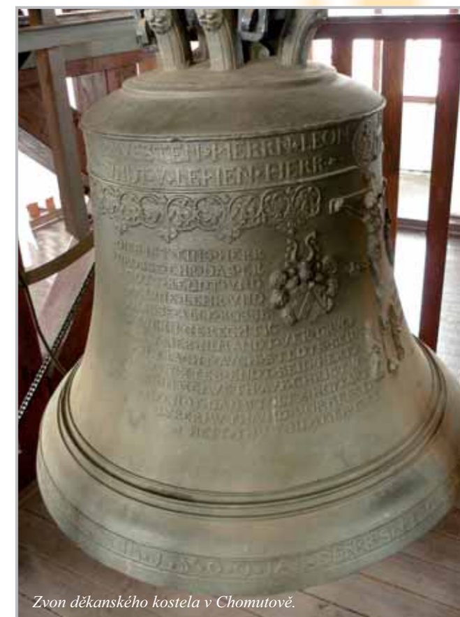
Zvon děkanského kostela v Chomutově.