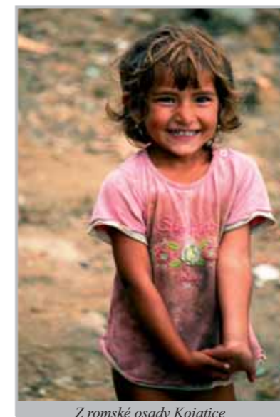
Z romské osady Kojatice

V Mongolsku je DCH Litoměřice spoluřešitelem několika projektů. „V roce 2010 byla ukončena realizace dvou projektů zahraniční rozvojové spolupráce. Prvním byla Příprava a zavedení studijního programu sociální práce – Ulánbátar. Podařilo se zavést modernizovaný vzdělávací program Sociální práce a zpřístupnit kvalitní sociální služby postiženým a zranitelným skupinám v Ulánbátaru a vybudovat studijní středisko vybavené odbornou literaturou a výpočetní technikou, které bylo předáno partnerské univerzitě v Ulánbátaru. Druhým projektem byla Socioekonomická stabilizace geograficky a sociálně odložených komunit. Jeho cílem bylo zpřístupnit obyvatelům kraje Bulgan vzdělávání v jejich přirozeném prostředí formou interaktivního radiovysílání a zpřístupnit těmto lidem terénní sociální služby. Během realizace projektu bylo zřízeno 38 „jurtových“ školek ve 12 oblastech provincie Bulgan, které navštěvovalo 806 dětí ve věku 3-6 let. Třetím projektem je Pomoc rodinám postiženým katastrofickými mrazy. V reakci na tuto situaci