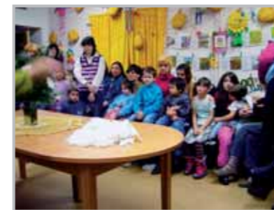
Domov sv. Máří Magdalény v Jiřetíně pod Jedlovou

Kromě výše uvedených služeb poskytuje zařízení službu Odborného sociálního poradenství pro handicapované osoby. Při Domově vzniklo také Centrum sociální rehabilitace. V Centru je poskytována pobytová služba sociální rehabilitace, která je určena nejen pro klientky Domova,